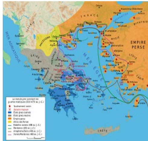
L'Empire Perse vers -490.

Au début du Vème siècle, les cités grecques durent affronter une nouvelle menace : au cours de la Première Guerre médique, en – 490 , les armées de l'immense et puissant Empire perse tentèrent d'envahir la Grèce. Une cité joua un rôle capital dans la victoire contre les Perses: Athènes : le général athénien Miltiade remporta une nette victoire dans la plaine de Marathon (-490) contre les Perses. Le stratège athénien Thémistocle fit construire ensuite 200 trières et fortifier le port du Pirée . Lors de la Seconde Guerre médique , les Athéniens jouèrent un rôle majeur à Salamine , théâtre en -480 d'une bataille navale décisive. Cette victoire avait été précédé de quelques semaines de l'exploit des spartiates aux Thermopyles . La victoire terrestre de Platée en -479 offrit aux Grecs un ultime succès qui mit un terme aux Guerres médiques . Athènes domina ensuite une grande partie du monde grec : de nombreuses cités intégrèrent la ligue de Délos , dominée et dirigée de fait par Athènes.