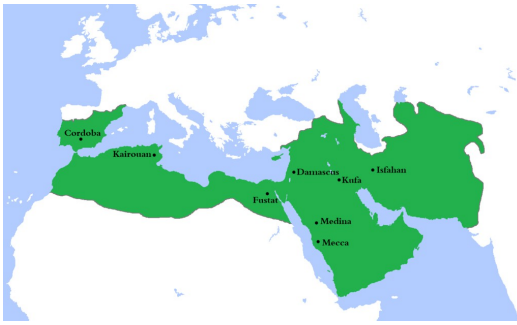
L'Empire arabo-musulman sous les Omeyyades

Les quatre premiers califes (632-661) étendirent la domination du nouvel État sur le Proche-Orient et l'Égypte. À partir de 661, les califes de la dynastie omeyyade dominèrent l'empire arabo-musulman qui atteint au VIII ème siècle son extension maximale, allant de l'Espagne à l'ouest au fleuve Indus à l'est. Cette dynastie régnait à partir de Damas , située en Syrie. Il y firent construire la Grande mosquée qui existe toujours à notre époque et qui fixa les grands principes architecturaux sur lesquels toutes les autres mosquées furent ensuite bâties. Les Omeyyades perdirent le pouvoir sur le califat en 750 et furent alors remplacés par la dynastie des Abbassides qui déplacèrent la capitale à Bagdad .